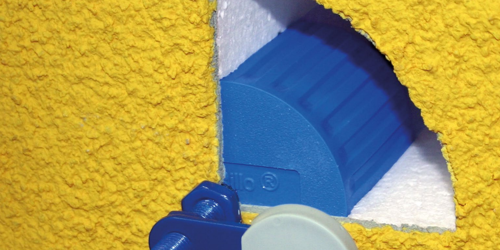
Cylindre de montage ZyRillo®-PE