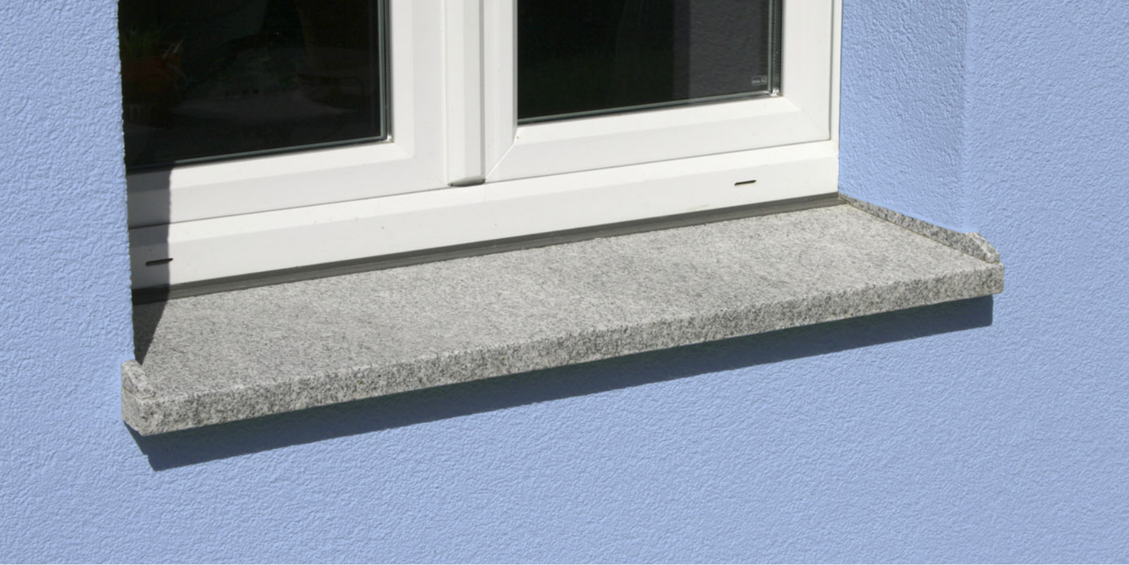
Fensterbänke aus Granit