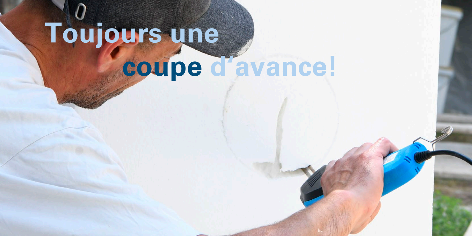
Coupeuse électrique à main 20